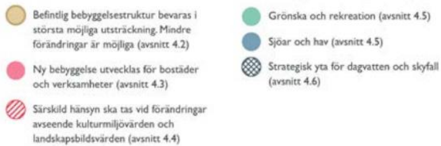
Figur 1. Vägledning för bevarande och utveckling av Björknäs och Eknäs, (Nacka kommun, 2024).